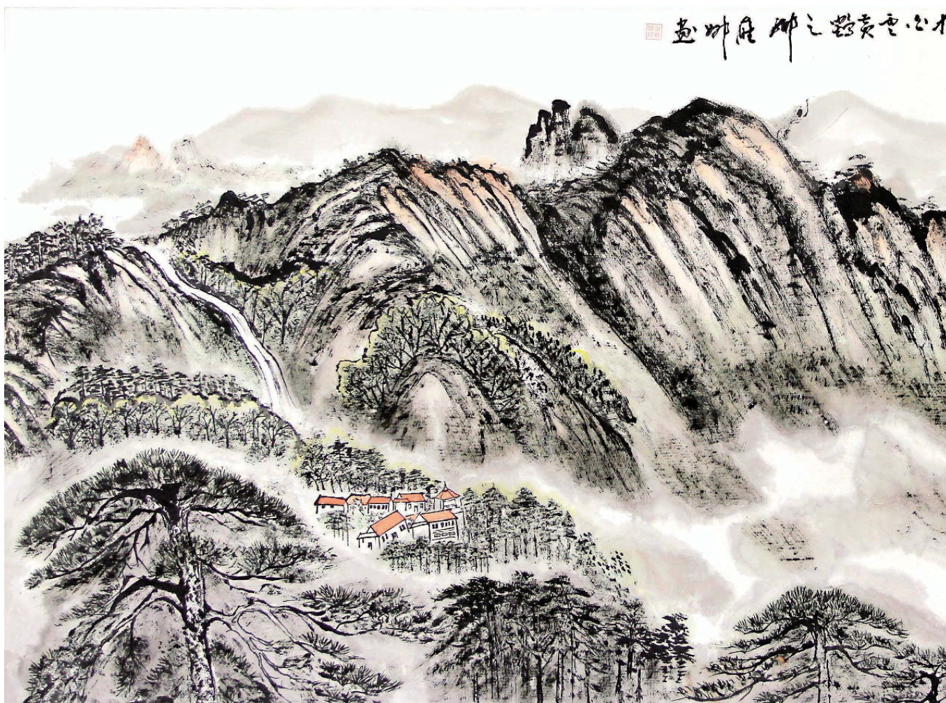
江山无限美 谢雁娜画