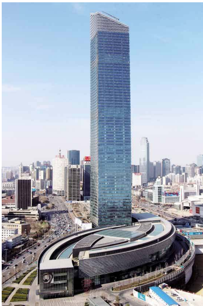
沈阳台府恒隆广场