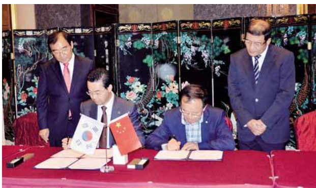
2015年10月29日，武汉建筑业协会与大韩专门建设协会忠清北道会签署合作谅解备忘录。