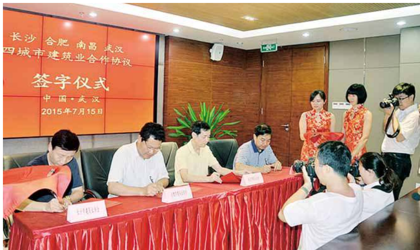
2016年7月15日,长沙、合肥、南昌、武汉四城市建筑业签署《合作协议》。

在这一点上,以推动武汉建筑业科学发展为核心,调整体制机制,注重改革创新,努力提高武汉建筑业整体水平和会员企业核心竞争能力,成为武汉建筑业协会不懈努力的目标。进入“十三五”时期以来,协会积极推动建筑产业现代化政策的落实,提出推进全市建筑产业现代化工作的意见和建议;加强钢结构课题研究,推进桥梁钢结构进程;组建面向行业的培训机构,整合武汉地区建筑行业培训资源;组建面向会员企业的法务部门,提高法律咨询和服务水平;探索建立武汉市优质建