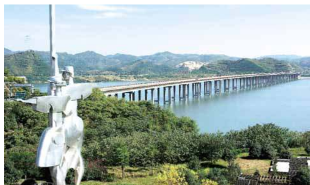
湖北路桥承建的汉十高速十堰至襄阳段