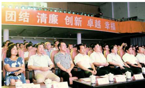
2016年7月31日,武汉建筑业第二届“奥斯卡”颁奖典礼在楚天会堂举行。

高办会水平;整合“一报一刊”,改版网站,丰富微信公众号内容模式,进一步提高宣传能力,提升了协会与会员的形象,收到了良好的社会宣传效果。此外,诸办开展“冬歇磨刀”、利用空闲时间,组织集体素质拓展等活动,极大增强了协会秘书处的团队凝聚力和协作力。