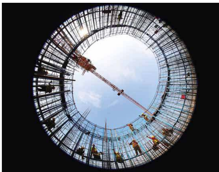
天津 117 大厦上的工人正在施工