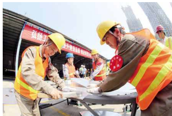
磨刀霍霍