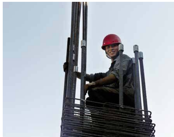
最是那一抹微笑