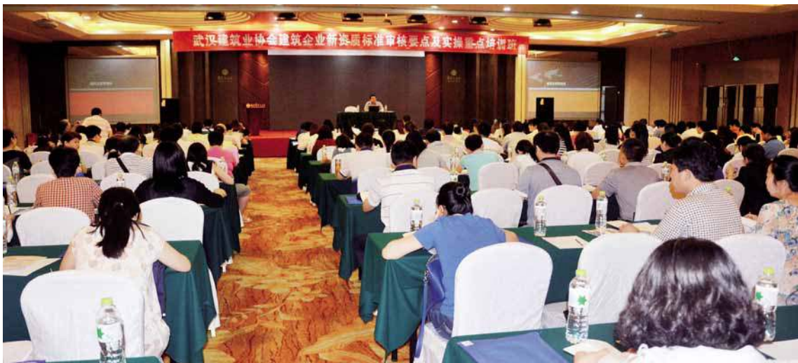
2015年6月18日，由武汉建筑业协会主办的建筑业新资质标准要点及实操重点培训班在武昌华天大酒店圆满结束。

服务会员，要把工作做精做透。协会工作人员积极转变作风，求真务实，通过多次走访、建微信群有奖互动、新会员回访等措施，密切与会员单位沟通联系。据不完全统计，2015年，秘书处共走访会员单位100余家（次），会员单位主动到协会咨询工作、寻求帮助达1000余人次。截至2016年8月31日，会员总数达到628家，占武汉市建筑企业总数的一半以上。