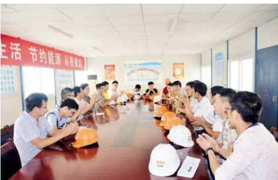
2015年7月21日下午,协会在武汉建工集团青山棚户区改造二期项目发出防暑降标“八个要”倡议。

“十三五”时期,武汉建筑业将迎来重大利好和难得的发展机遇。下一步,武汉建筑业协会还在思考,既要在提供服务、反映诉求、规范行为等方面做出新的成绩,更要在行业服务、行业自律、行业协调、行业代表上作出新贡献,服务于会员单位,取信于政府部门,贡献于建筑行业,在理顺和梳理政府与市场的关系中找到自身立足点,在化解社会矛盾、改善群众生活、构建和谐社会中担当更重要角色,既审慎稳妥又坚定果敢,真正让协会这个“龙头”带动行业发展,统出一片新天地。同时,也可为其他社会组织的改革提供示范和借鉴,更好发挥协会商会在国家治理体系和治理能力现代化中的应有作用。