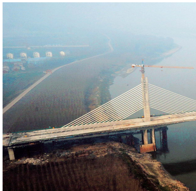
三官汉江公路大桥