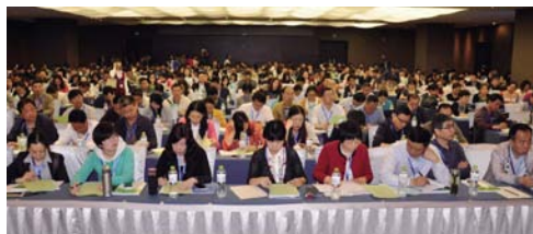
4月27-28日，协会联合主办的营改增培训在纽宾凯鲁广国际酒店举行，来自会员单位等企业的500人参加培训。