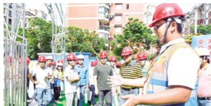
正在向参观人员讲解安全体验区安全注意事项