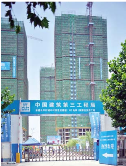
长丰村城中村改造还建楼 (H2 地块) 保障性安居工程大门入口