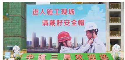
中建三局欢迎你宣传画

本报讯(曾院平 干玉珍)城中村改造还建楼是社会关注的热点,工程质量建造得如何?是还建楼村民最关心的事!6月5日,记者走进武汉市桥口区长丰村城中村改造还建楼(H2地块)保障性安居工地,带你去看看在建的这一工程。通过这些图片,进行进一步解读中建三局在建设行业的示范引领作用,武汉城中村改造还建楼工程质量同样让住户住上放心房,工程交给中建三局建我们放心!