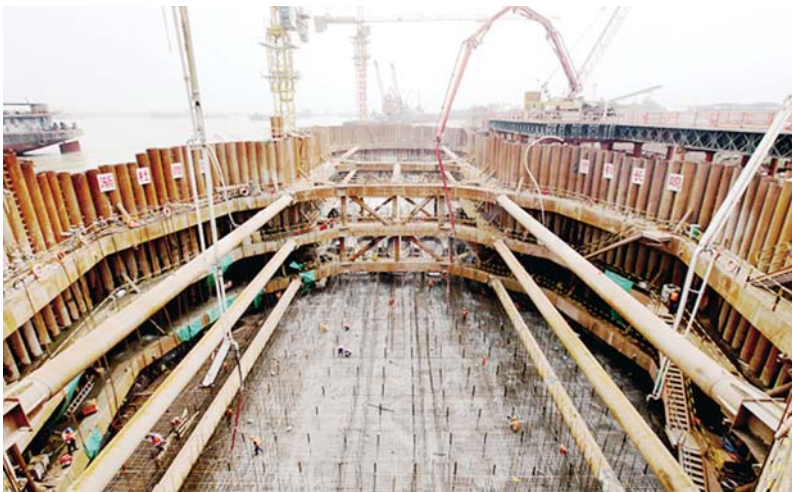
世界最大哑铃型承台首层混凝土浇筑完成

在主墩钻孔桩施工中, 中铁大桥局武汉青山长江大桥的建设者开创了长江水域主墩成功使用大型旋挖钻施工的先例; 特别是19号主墩施工, 一分部仅用84天就完成了60根超深、大直径钻孔桩施工任务, 施工速度打破了世界同类型钻孔桩施工记录, 创造了长江上大型桥梁主墩基础施工的奇迹; 自2月21日武汉青山长江大桥19号南主塔墩钻孔桩成功浇筑以来, 一分部仅用75天时间就安全、高