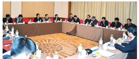
2月24日下午,协会2016年第一次建筑市场管理工作座谈会在汉口新华诺富特酒店举行。