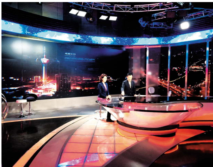
佑图公司承建的成都台高清新闻演播室全新亮相

演播室设有新闻主播台、访谈区、自由解说区等不同景区,灯光的布置要同时满足不同分区的使用和切换,这就要求各景区的灯光同时使用而又互不影响,MacOLEDs所有灯具的色温、照度、显色性等指标高度统一,加上灯具的布置精准高效,最终打造出整体感很强的直播场景,这势必会成为佑图的又一个工程典范。