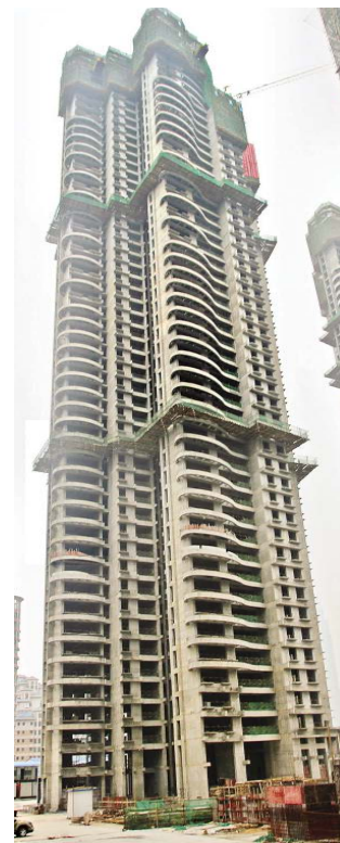
新八集团都市经典一期二标段超高层工程喜封金顶