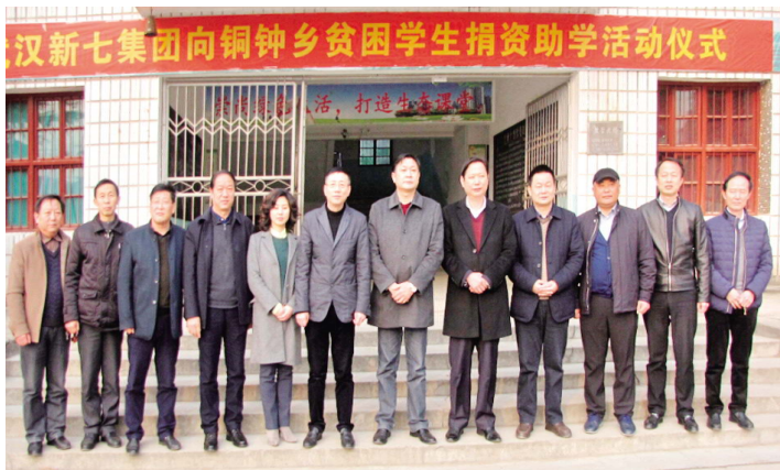
当地党政领导与新七集团领导在铜钟乡贫困学生捐资助学活动现场