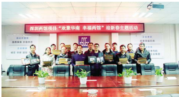
华南公司深圳两馆项目举行“欢聚华南 幸福两馆”迎新春主题活动