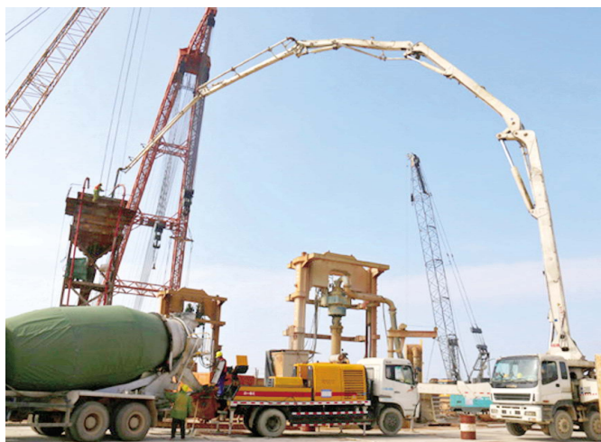
平潭海峡公铁两用跨海大桥大小练航道桥主塔墩桩基础全部灌注完成

大小练航道桥超大直径钻孔桩的顺利完成不仅刷新了世界上最大直径钻孔桩施工的记录,也为我国海上公铁两用桥大孔径桩基础施工积累了丰富的经验,奠定了坚实的基础。钻孔桩施工结束后,大桥将由下部结构施工向上部结构施工转化,开始斜拉桥承米的施工。