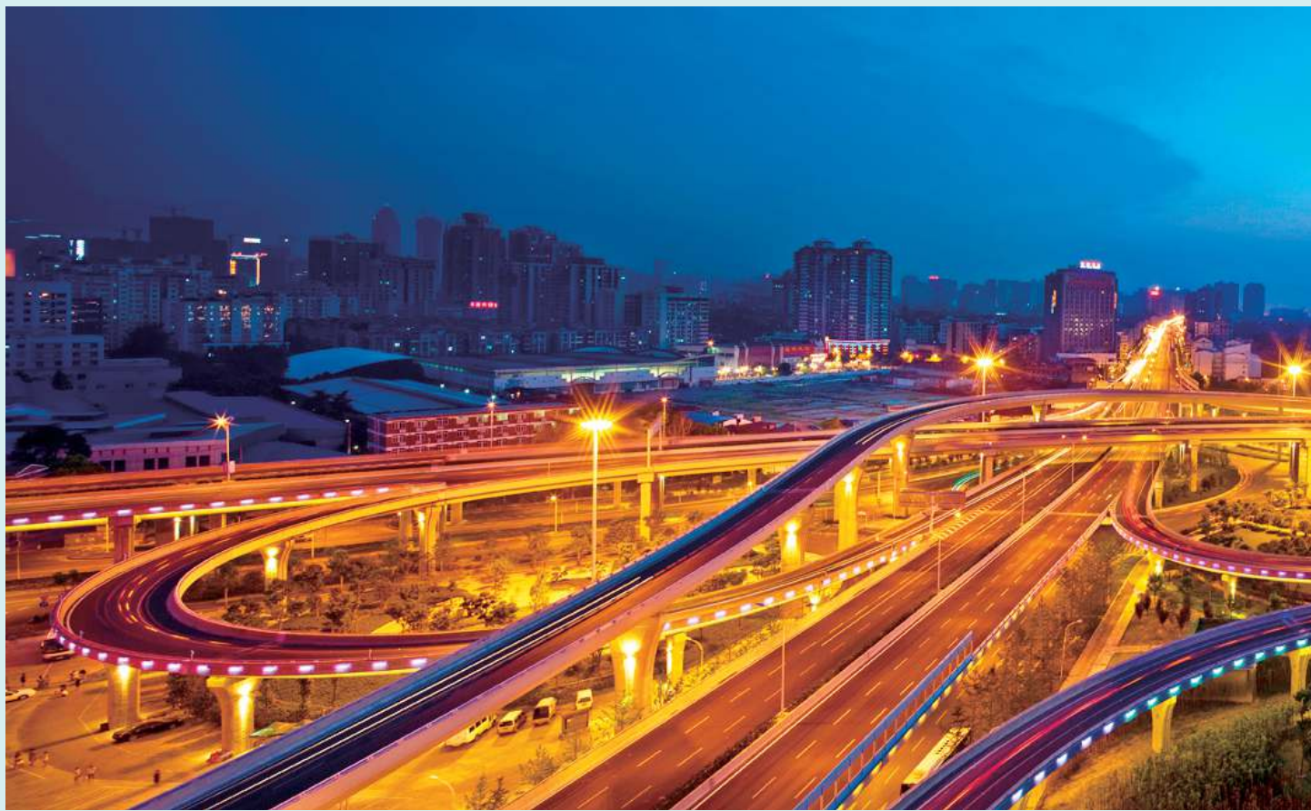
▲竹叶山立交夜景。