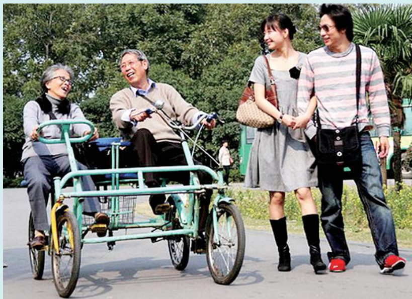
▲天伦之乐。