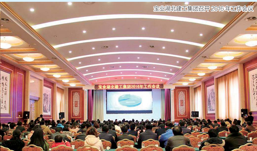
宝业湖北建工集团召开2016年工作会议