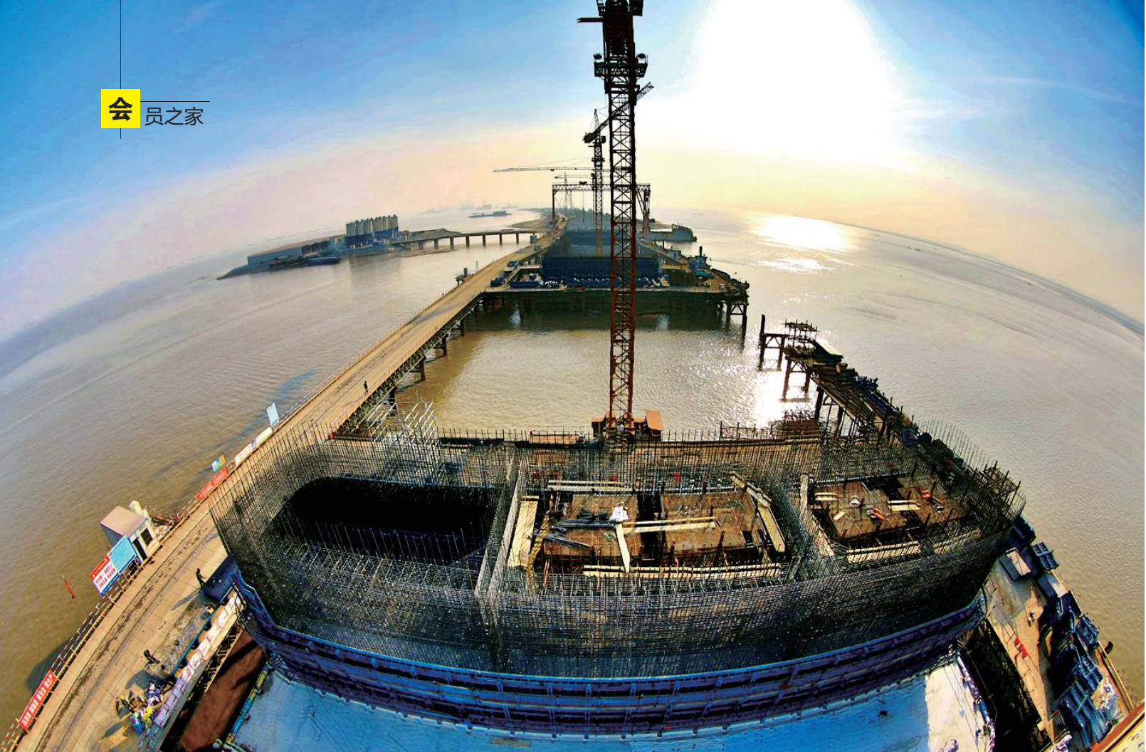
一路向北。