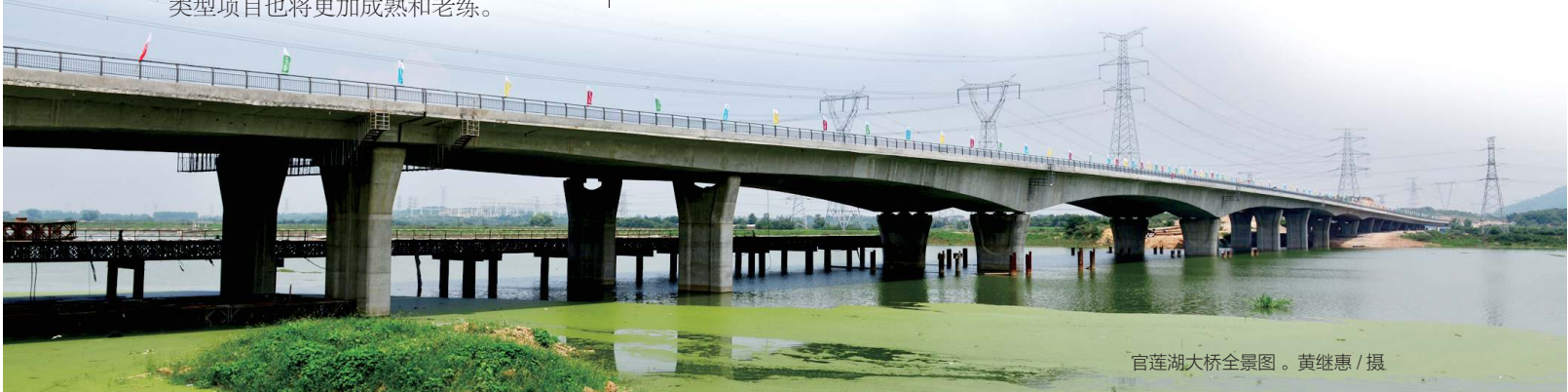
官莲湖大桥全景图。

市场主体情绪宣泄的背后折射出机制的缺陷。住建部印发的“规定”，既是对一些地方人为设置