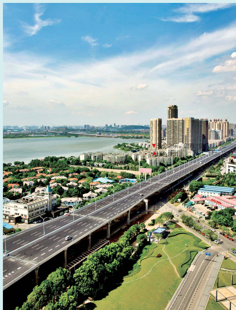
▼东风大道全景。