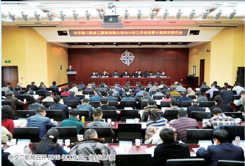
中交二航局召开2016年工作会。