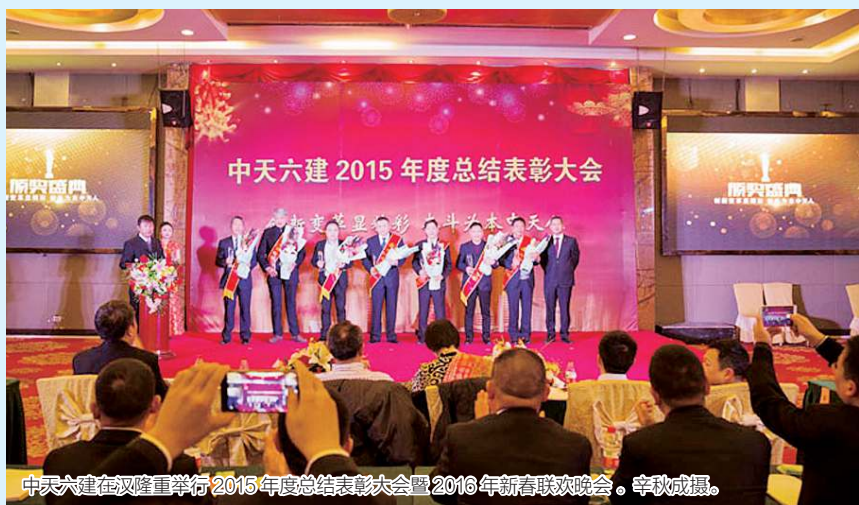
中天六建在汉隆重举行 2015 年度总结表彰大会暨 2016 年新春联欢晚会。

在寒潮中，六建及全体同仁首先要进行思想上的转型和创新，不断的强化自我，努力奋斗，在这个冬天储备能量，迎接春天的到来，做“春天的使者”。