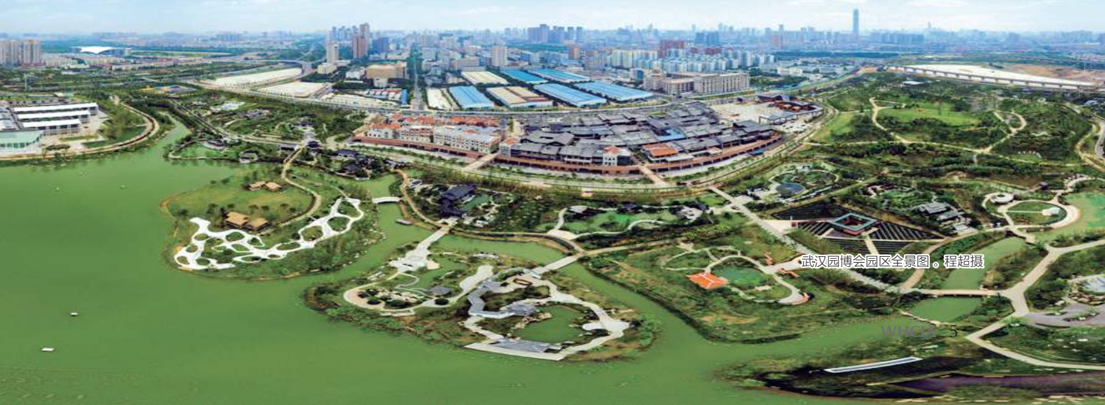
武汉园博会园区全景图。