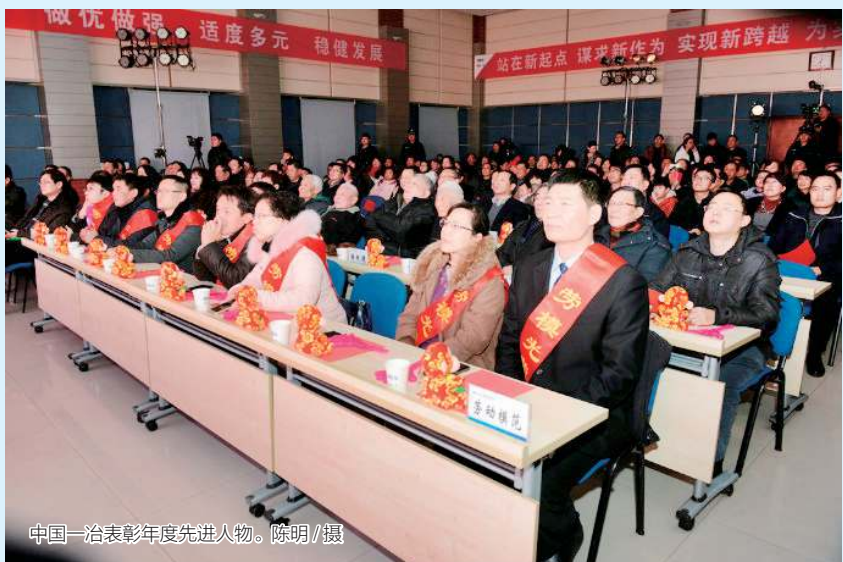
中国一冶表彰年度先进人物。

中国一冶2016年要按照中冶集团“打造全球最强最优最大冶金建设运营服务国家队”的战略目标，坚持“两商”战略定位，全面实施“四五”规划，推进“三纵三横两支撑”业务发展战略，打造“四梁八柱”业务升级版，加强创新驱动，加快优化升级，着力提质增效，确保实现公司快速高效发展，向着跨入中冶集团第一梯队的目标奋力迈进。一是坚定不移地做大做强做优主业，确保经营规模可持续发展；二是坚持以市场营销为龙头，加强开放合作，推动市场开拓的大提升、大跨越；三是大力推进体制机制创新，增强企业发展活力动力；四是加强人力资源开发和管理，挖掘和释放“人才红利”；五是推进新技术研发和应用；六是突出全面从严治企，加强党的建设、班子建设、廉政作风建设和队伍建设。