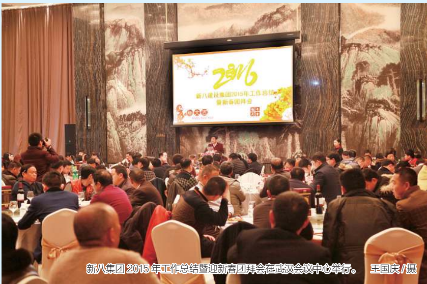
新八集团2015年工作总结暨迎新春团拜会在武汉会议中心举行。