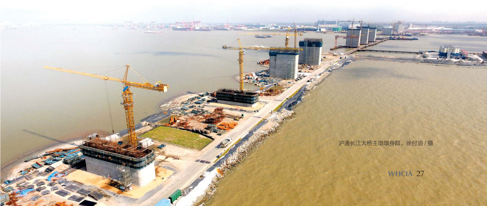
沪通长江大桥主墩墩身群。

蒋成双强调,杨志德精神和沪通理念是公司发展进程中的宝贵财富,我们既要呵护,更要传颂。沪通项目全体员工要自学自励抓“四诊”,群策群力促“四化”,全心全意围绕“四更”打造沪通长江大桥二航金字招牌。蒋成双最后号召公司上下凝心聚力,同舟共济,继续掀起 2016 年再学沪通新高潮,为公司新年起好步、开好头不断注入源头活水与不竭动力。