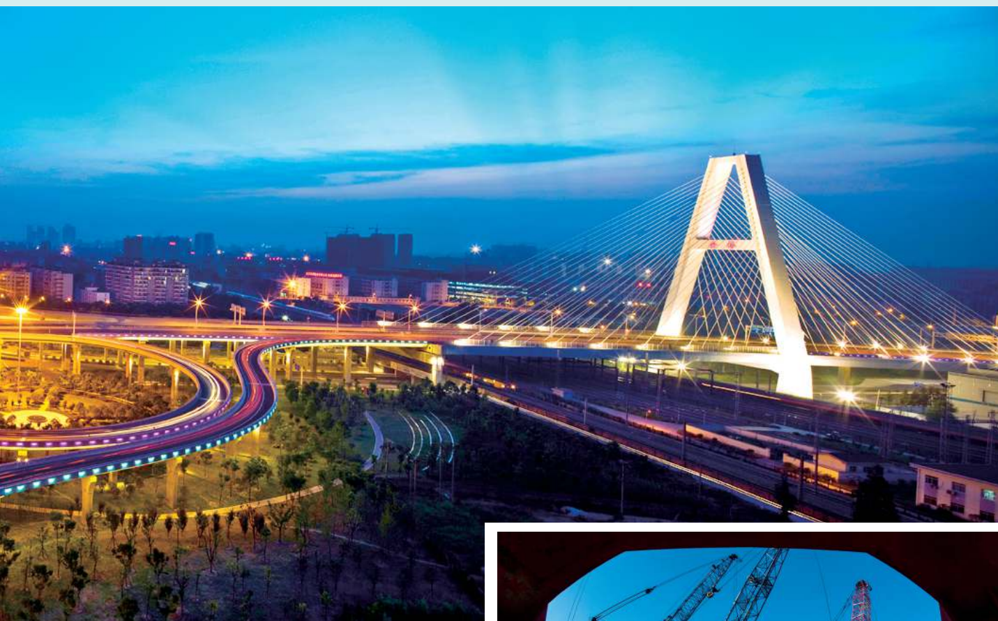
►站在建筑楼顶观看 “武汉蓝”。