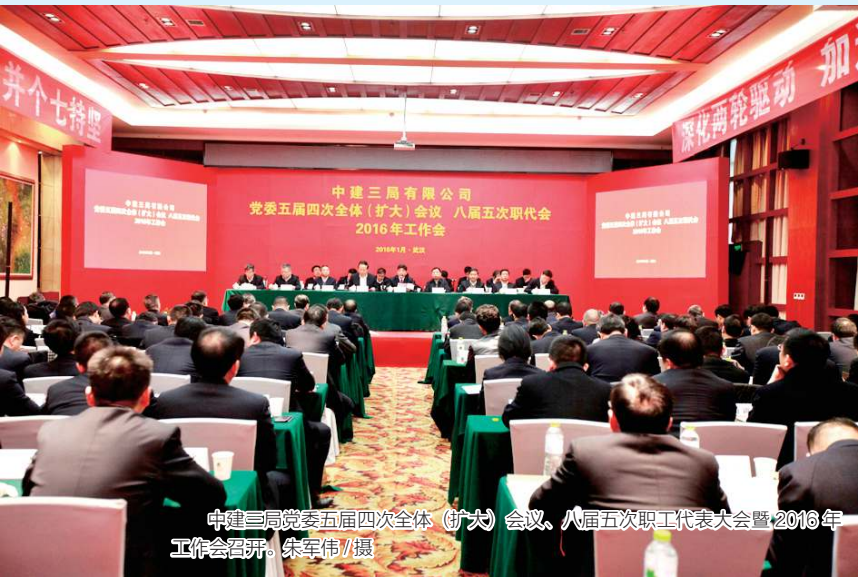
中建三局党委五届四次全体（扩大）会议、八届五次职工代表大会暨2016年工作会召开。