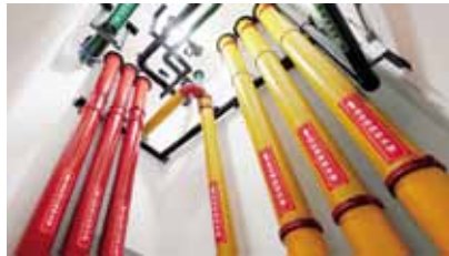
湖北能源调度大楼 管道井