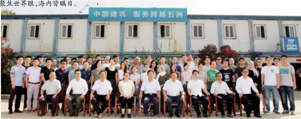
2017年8月 相关部门与项目班子合影