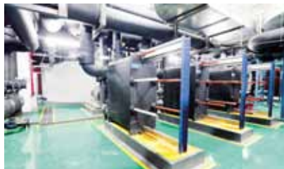
湖北能源调度大楼 暖通机房