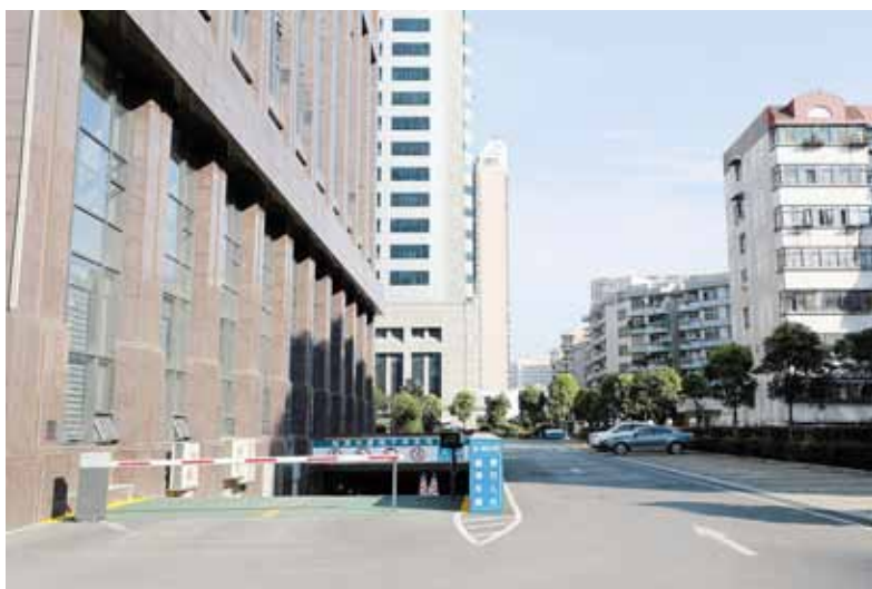
湖北能源调度大楼 室外