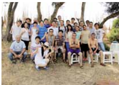
2014年8月9日 部门畅游帝巴萨