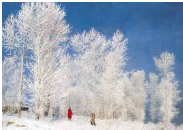
瑞雪兆丰年组图