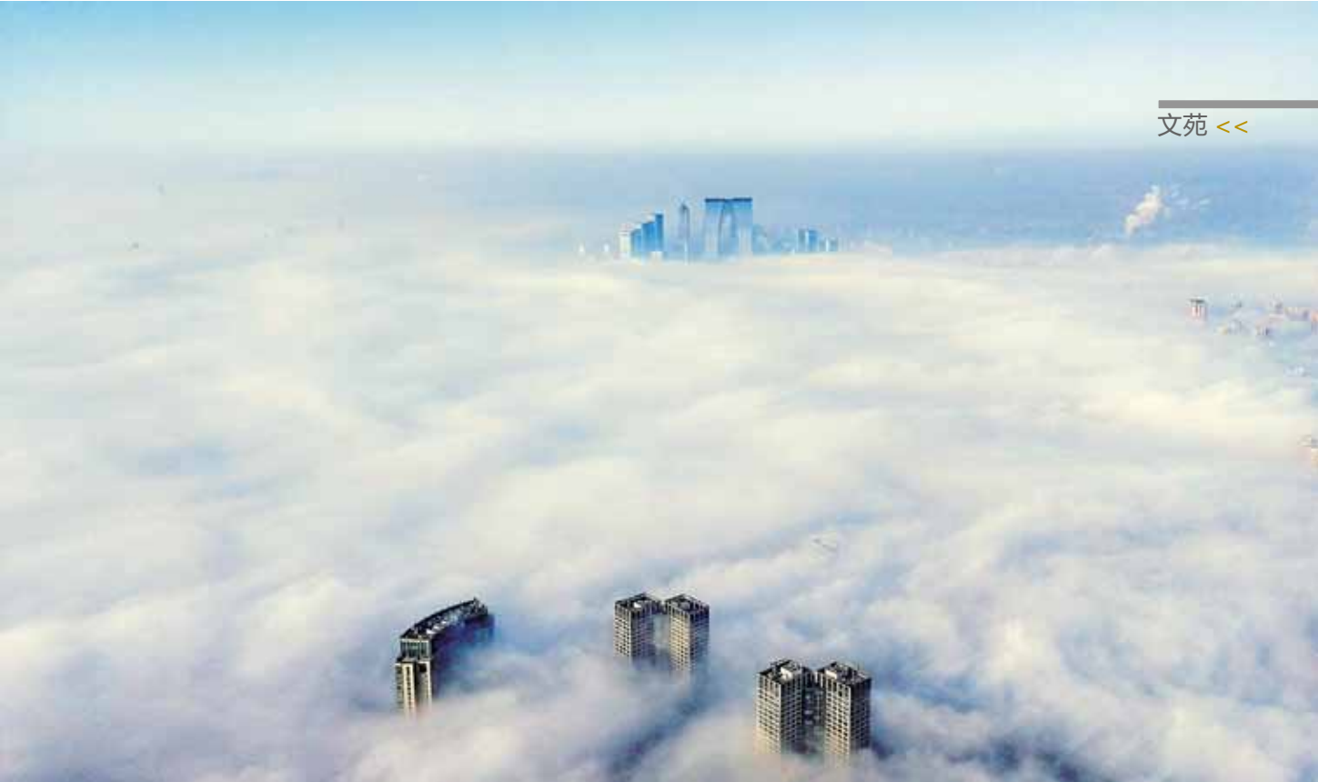
天堂视角下的姑苏城