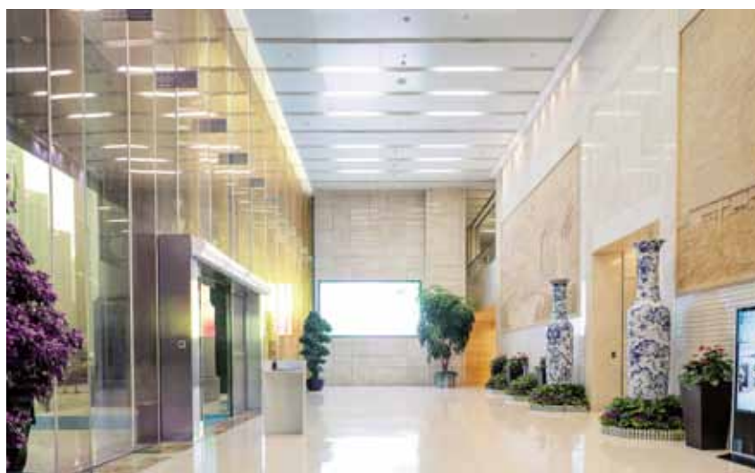
湖北能源调度大楼 一楼大堂