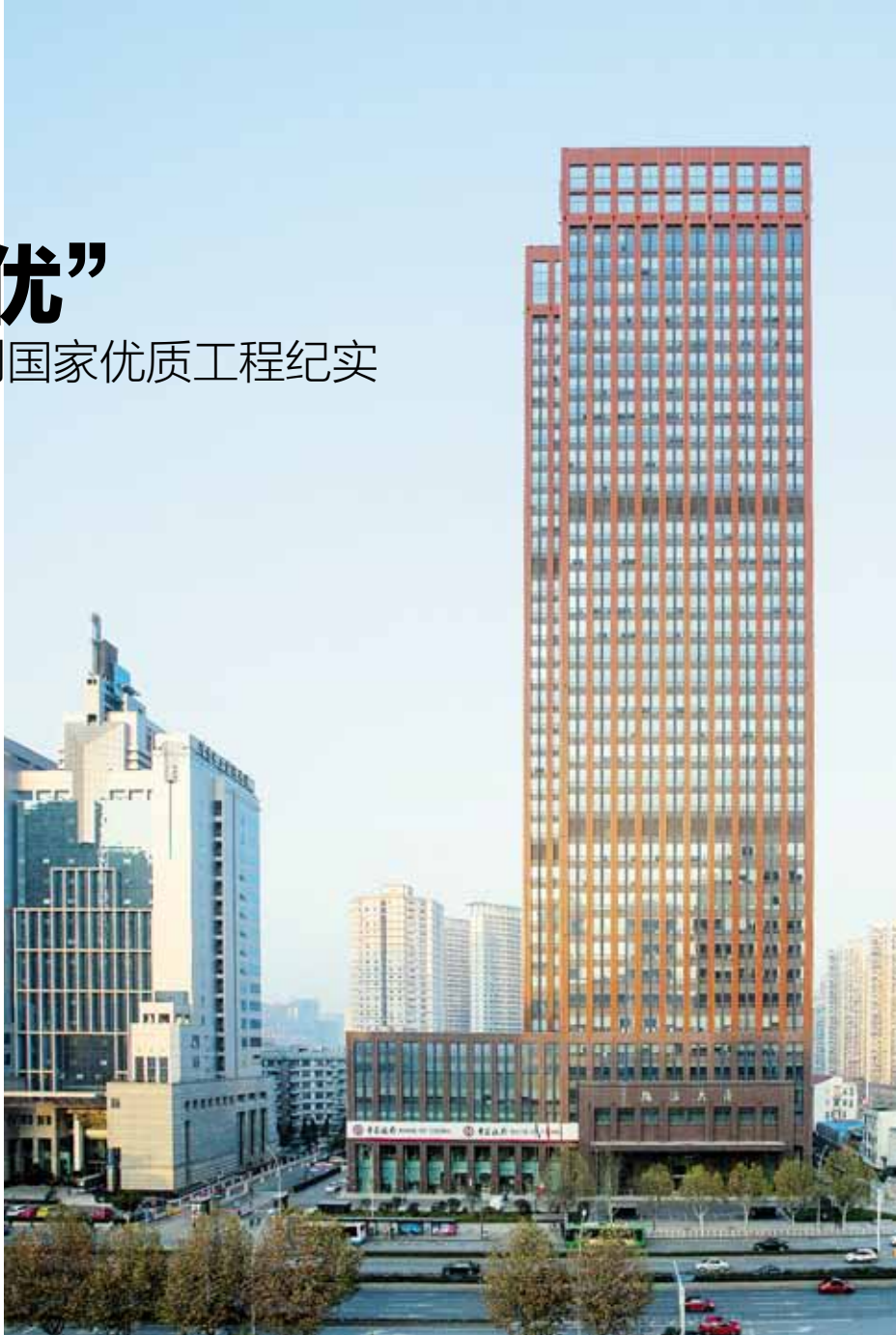
湖北能源调度大楼 正立面

“工程难度再大，也要排除万难，不能给湖北工建丢脸！”国际工程公司能源调度大楼项目团队以实际行动践行了这一诺言。