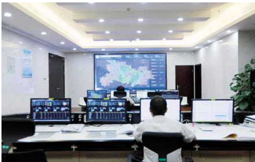
湖北能源调度大楼 能源集控中心