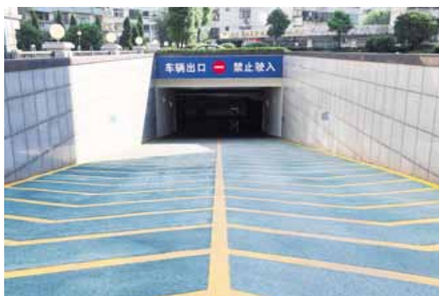
湖北能源调度大楼 车道

2013 年 10 月 28 日，地上 39 层、地下 3 层的能源大楼喜封金顶，进入到室内外装饰和设备安装阶段。