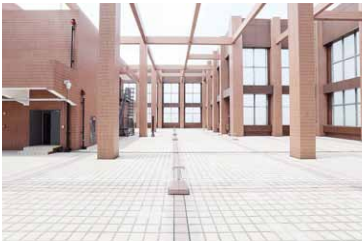
湖北能源调度大楼 主楼屋面

后记:本篇报道成文时,正是湖北能源大楼投入使用 2 周年的日子。目前,该大楼现已逐步成为湖北能源集团的电力、天然气调度管理和煤炭交易信息管理中心,主要承担该集团下属的清江电站、鄂州电厂共计约 700 万千瓦的电力调度任务,占到了湖北省 1/4 的电力调度任务,并计划在 2020 年前后逐步达到 1000 万千瓦的电力调度能力,为国家合理使用、及时提供电力能源起到了保障作用,取得了巨大的经济效益与社会效益。