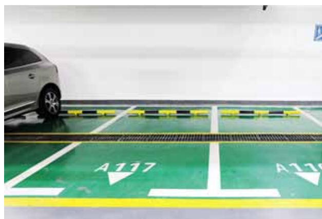
湖北能源调度大楼 地下室车库