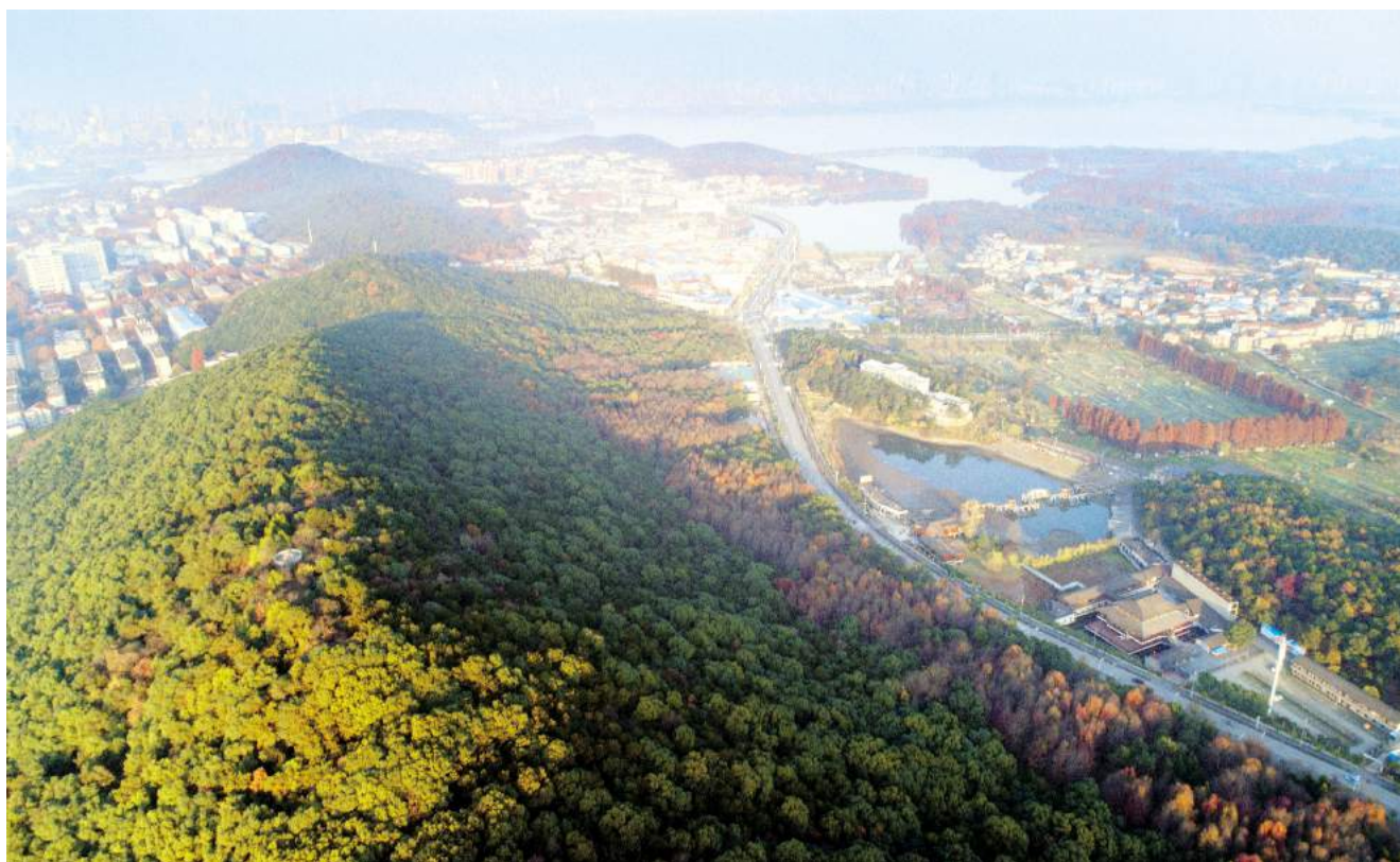
喻家山峰