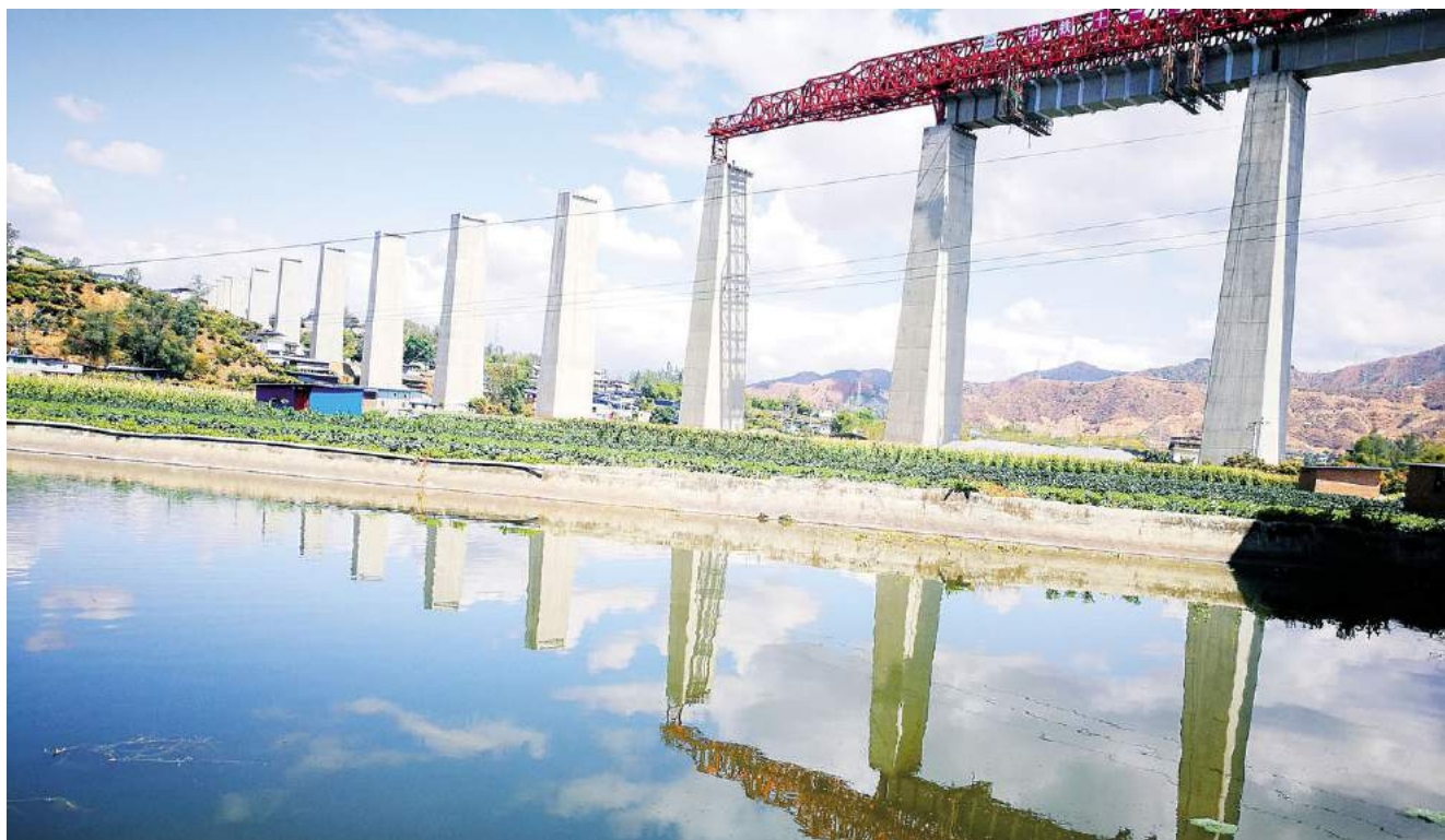
进行架设作业的海控湾特大桥