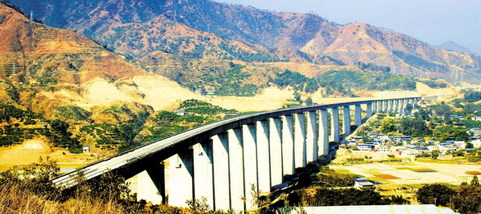
架设完毕的海控湾特大桥

本站四川攀枝花讯：四年光阴、春华秋实、筚路蓝缕。中铁十一局五公司米攀项目部用四年的智慧和汗水在成昆线抒写了浓墨重彩的一笔，创造了在川西山区建设高标准铁路的范例，证明了这支队伍还是当年的“铁道兵”。