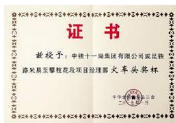
获得2016年火车头奖杯