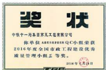
获得2016年中国市政工程协会QC发布三等奖

脚石”，而对于强者它是“垫脚石”，项目坚持创新驱动，积极开动脑筋进行探索。通过QC质量攻关，显著提高了节段拼装预制箱梁混凝土外观质量合格率。累计节约成本125312元。海控湾特大桥《提高节段拼装预制箱梁混凝土外观质量合格率》获得2017年重庆市市政协会QC发布一等奖，2017年全国市政工程协会QC发布三等奖。该桥已于2018年1月顺利架设完毕。