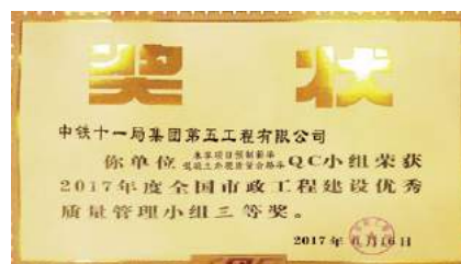
获得2017年中国市政工程协会QC发布三等奖