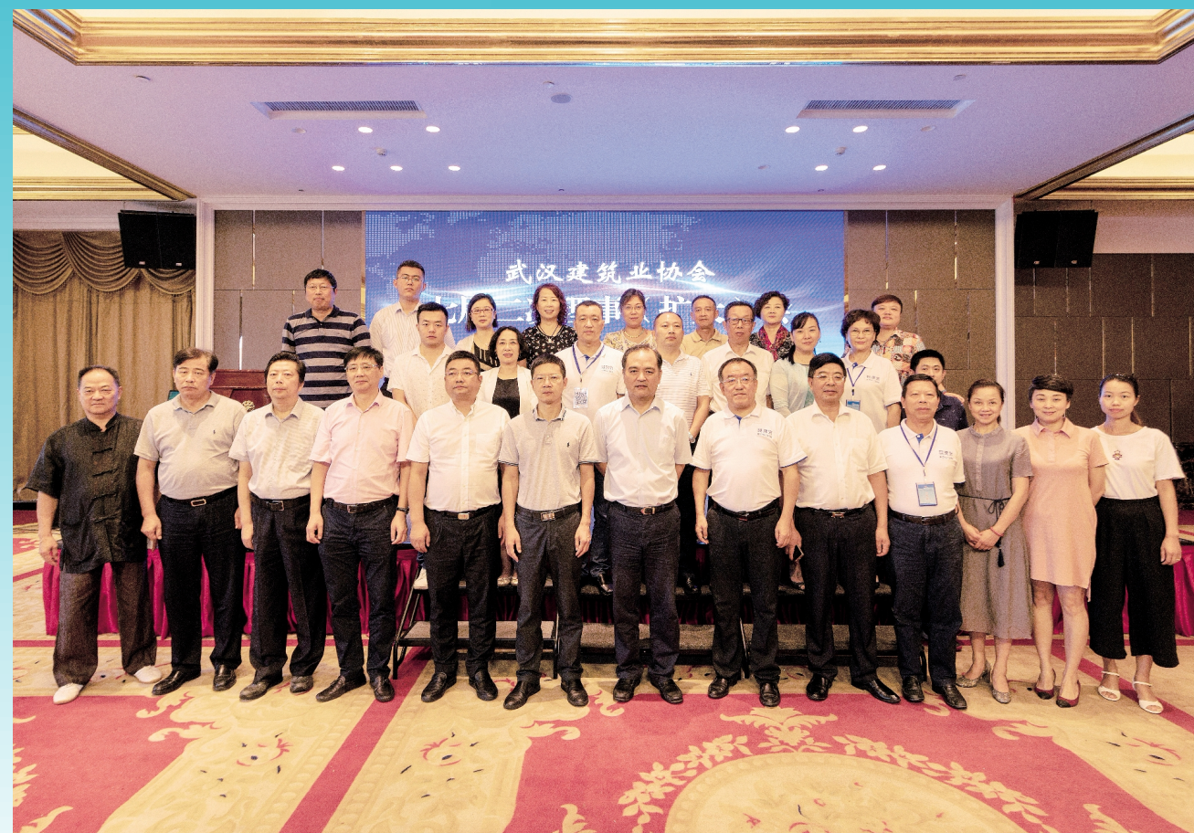
出席协会七届二次理事(扩大)会的领导、嘉宾与部分会员代表合影 2018年8月28日