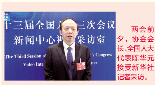
两会前夕，协会会长、全国人大代表陈华元接受新华社记者采访。