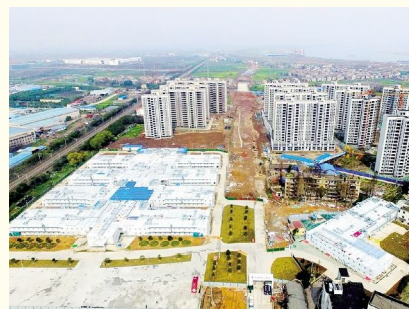
鄂州雷神山医院实景图

2020 年中国一冶 BIM 成果累计荣获抗疫特别贡献奖 3 项、一等奖 3 项、二等奖 10 项、三等奖 13 项。中国一冶 BIM 中心将以四类重点项目的 BIM 技术应用全覆盖为基础,持续创造示范效应,强化 BIM 技术落地应用,助力公司转型升级和高质量高速度发展。