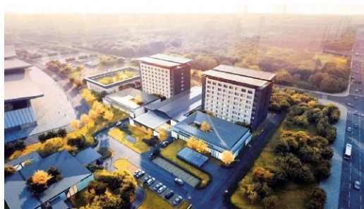
▲江汉平原产业交流中心项目高层接待中心鸟瞰图