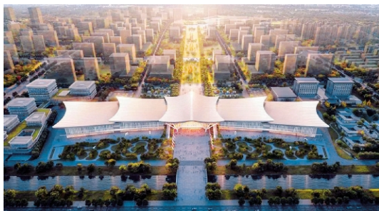
▲江汉平原产业交流中心项目总体鸟瞰图

该项目由中建科工投资、建设,位于湖北省荆州市沙市区荆州新城中轴线北段,总用地面积275亩,总建筑面积13万平方米,整体钢结构预估用量达3万吨,钢屋盖最大跨度达158米,最大悬挑距离达50米,主要建设内容包括产业交流中